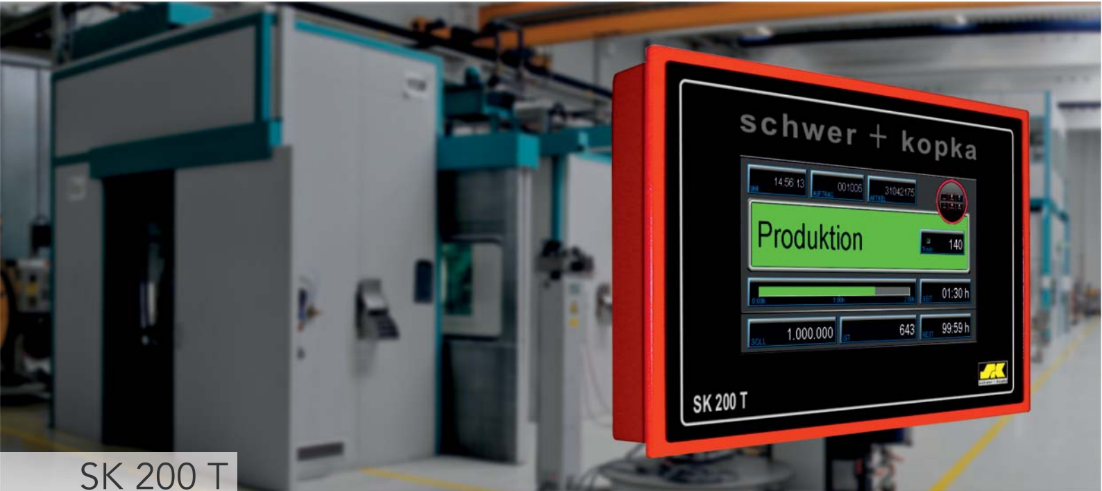
SK 200 T