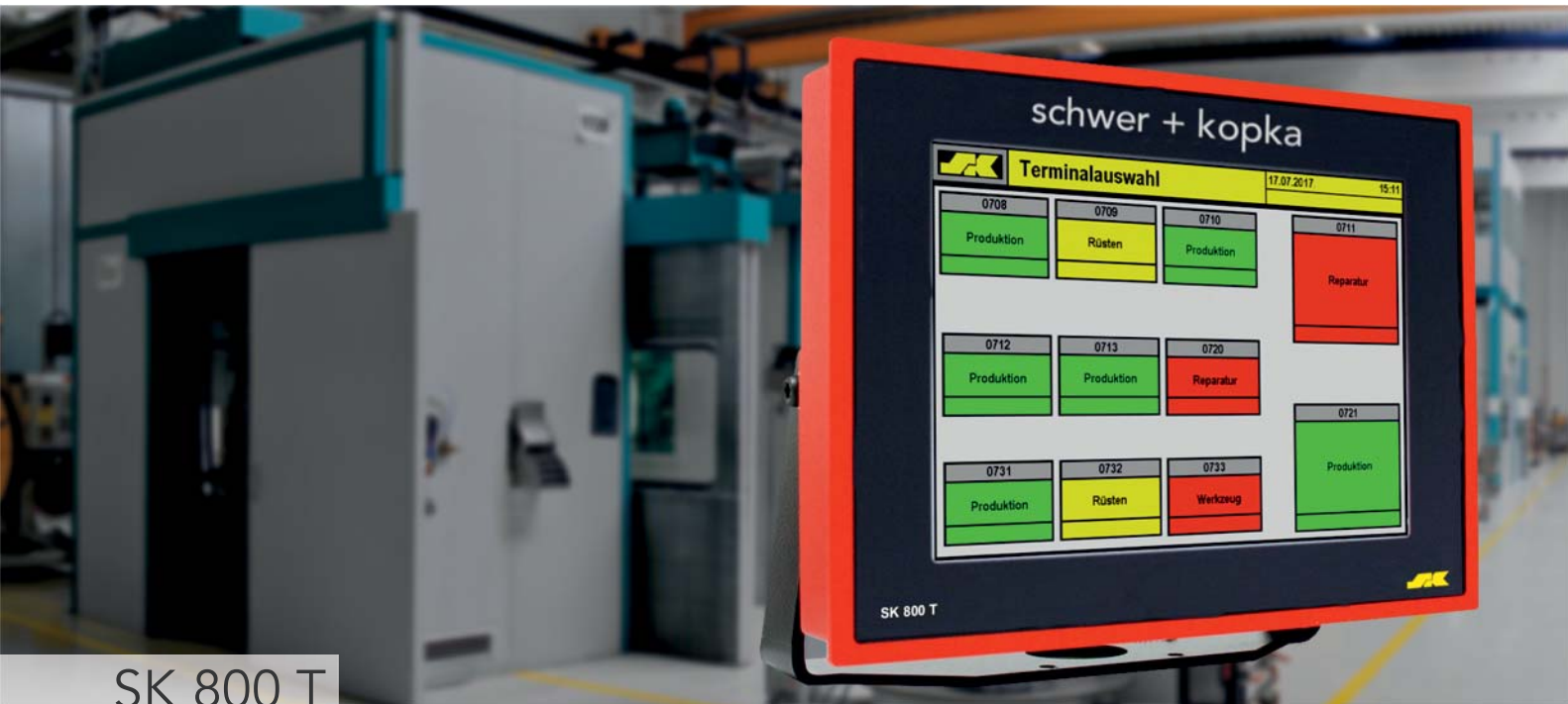
SK 800 T