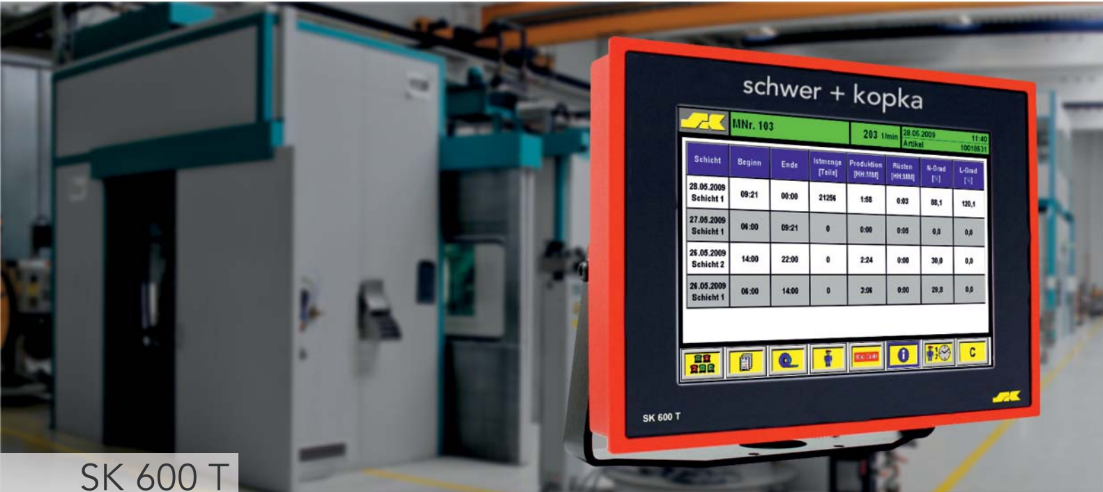
SK 600 T